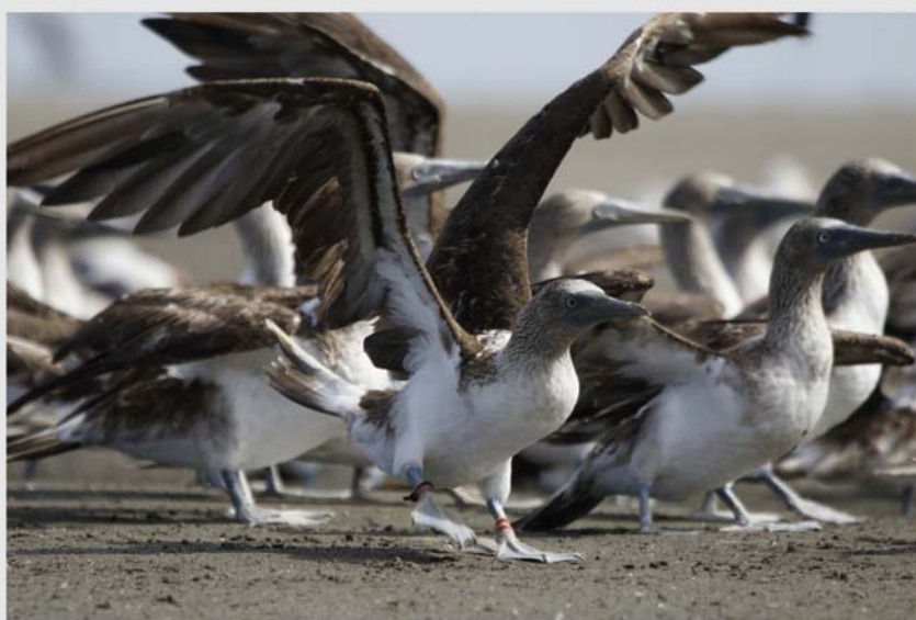
Aves en la costa de Sonora sobre el océano Pacífico.

medidas para evitar desastres en el futuro. Los modelos económicos adoptados hace más de 200 años, basados en el uso de fuentes de energía no renovables y contaminantes, desafían hoy a los políticos a pensar en