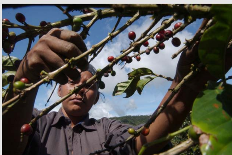
Cultivo de café en Costa Rica.

“Por una parte, la madera es un excelente aislante térmico y contribuye a la reducción de las necesidades de energía para acondicionamiento de temperatura ambiente de edificios; por