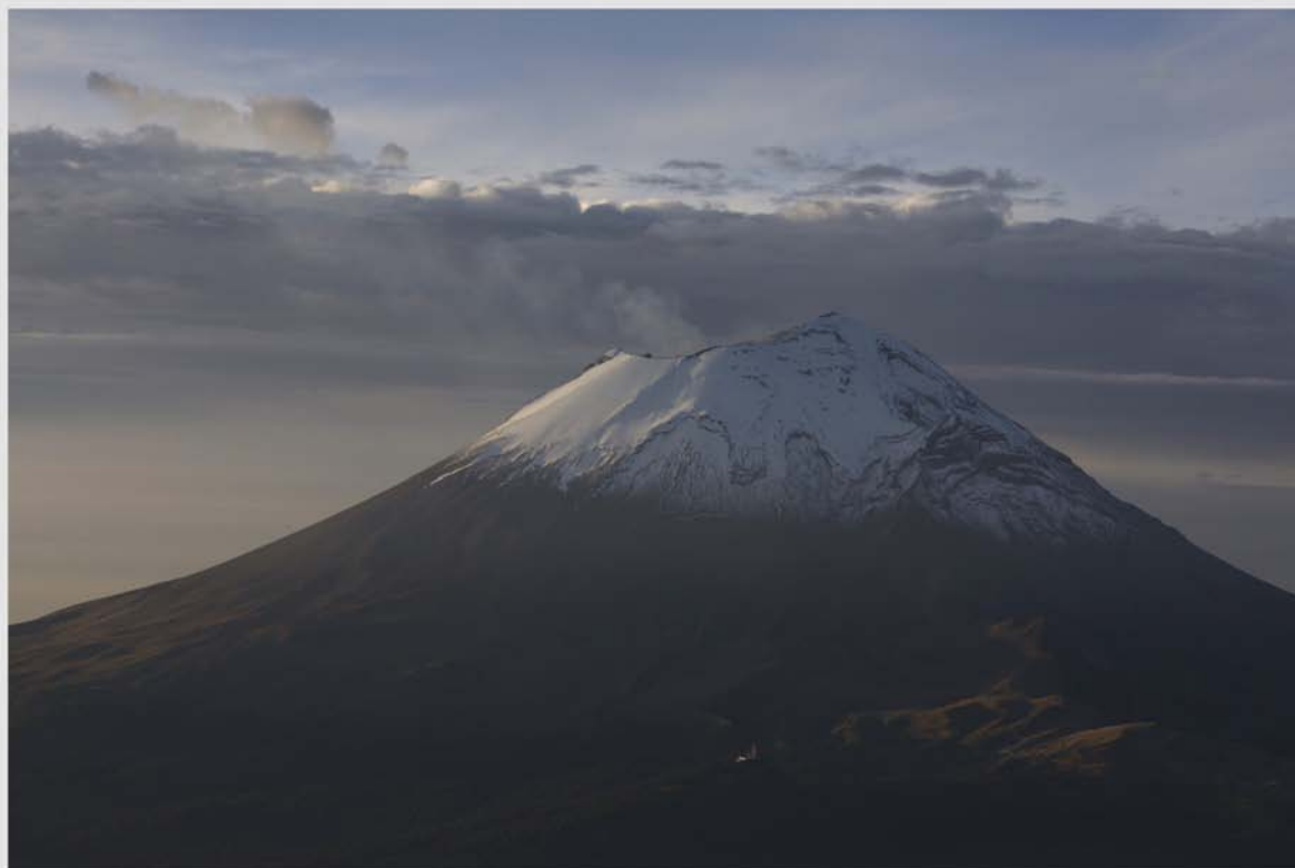
Volcán Popocatepetl. Sus hielos también se están derritiendo.

En el Pico de Orizaba y el Popocatepetl, los volcanes más altos del país, la tendencia es similar, pero en este último la reducción ha sido posiblemente acelerada aún más por la actividad volcánica de los últimos años. Los expertos estiman que, de mantenerse la velocidad a la cual se han reducido los glaciares del Iztaccíhuatl y