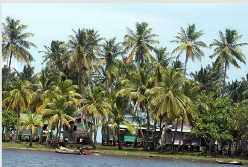
Aldea sobre la costa de Nicaragua en el mar Caribe.

un inventario de los eventos climáticos adversos que suceden en sus territorios y evaluar los daños y consecuencias en agricultura, salud, infraestructuras, y medir esos impactos en su economía y desarrollo.