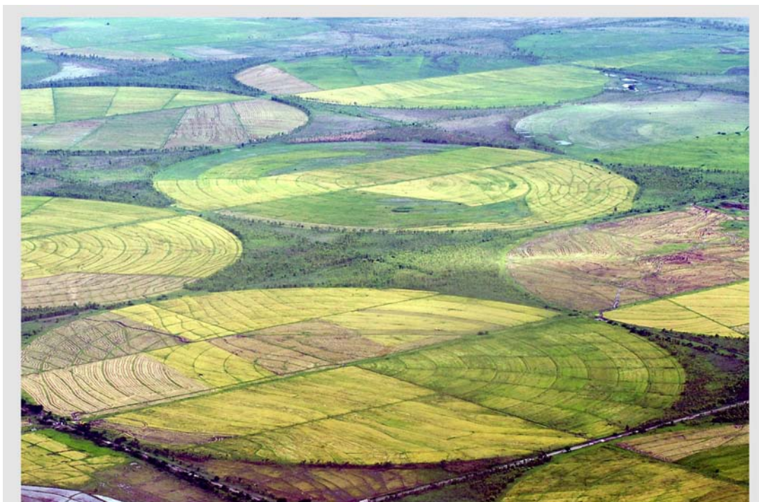
Vista aérea de cultivos en la Región Autónoma del Atlántico Norte, Nicaragua.

logro de objetivos ambientales”. En su opinión, el Protocolo es apenas un instrumento con metas a corto plazo. Pero destaca el alto grado de adhesión que ha tenido, con más de 180 países miembros.