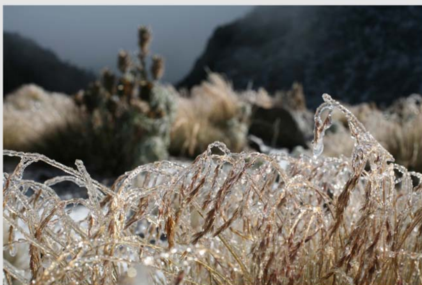
Hierba congelada en el Pico de Orizaba, México.

el Pico de Orizaba, es posible que desaparezcan por completo en los próximos 10 y 35 años, respectivamente, informó Tudela,