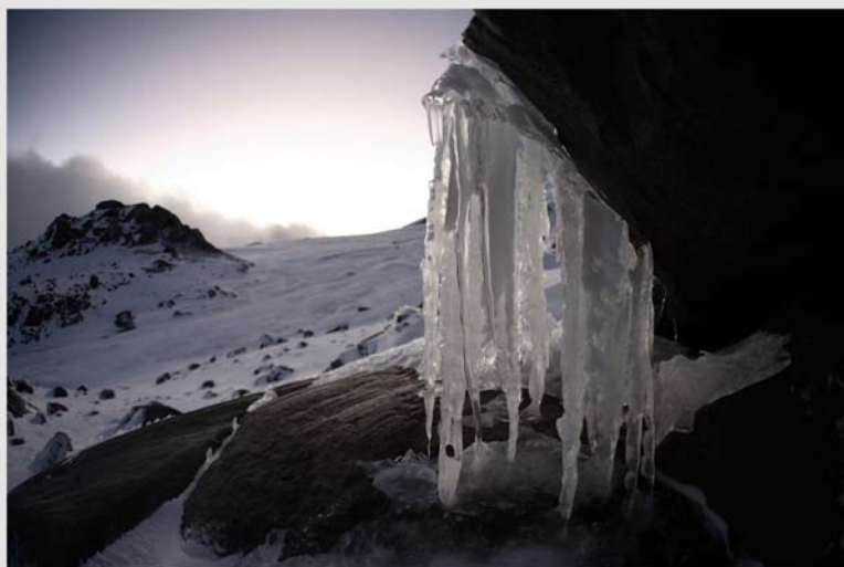
Deshielo en el Pico de Orizaba, México.

enfermedades, entre otros males. La preocupación surgió hace varias décadas, y muchas reuniones científicas y políticas se han realizado desde entonces. Pero cuando el mundo se prepara para discutir el tema en la Conferencia de las Partes de la Convención Marco de las Naciones Unidas sobre el Cambio Climático (COP