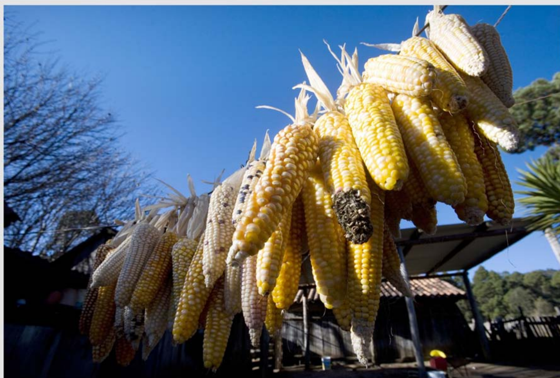
Mazorcas de maíz en Chiapas, México.

1998, el huracán Mitch, por ejemplo, mató entre 10.000 y 19.000 personas en varios países centroamericanos y causó daños estimados en 2/3 del producto interno bruto (PIB) sólo en Honduras. Hacia 2025 los daños producidos por huracanes se triplicarán, en relación a los niveles alcanzados en el período 1979-2006. Además, en el sector agrícola, la explotación desmedida de la tierra y la extensión de los campos de cultivo están arrasando con los bosques naturales. Esto favorece la explosión de las emisiones de dióxido de carbono a la atmósfera. Los bosques son fuentes de absorción de dióxido de carbono y cuando se deforesta se elimina ese