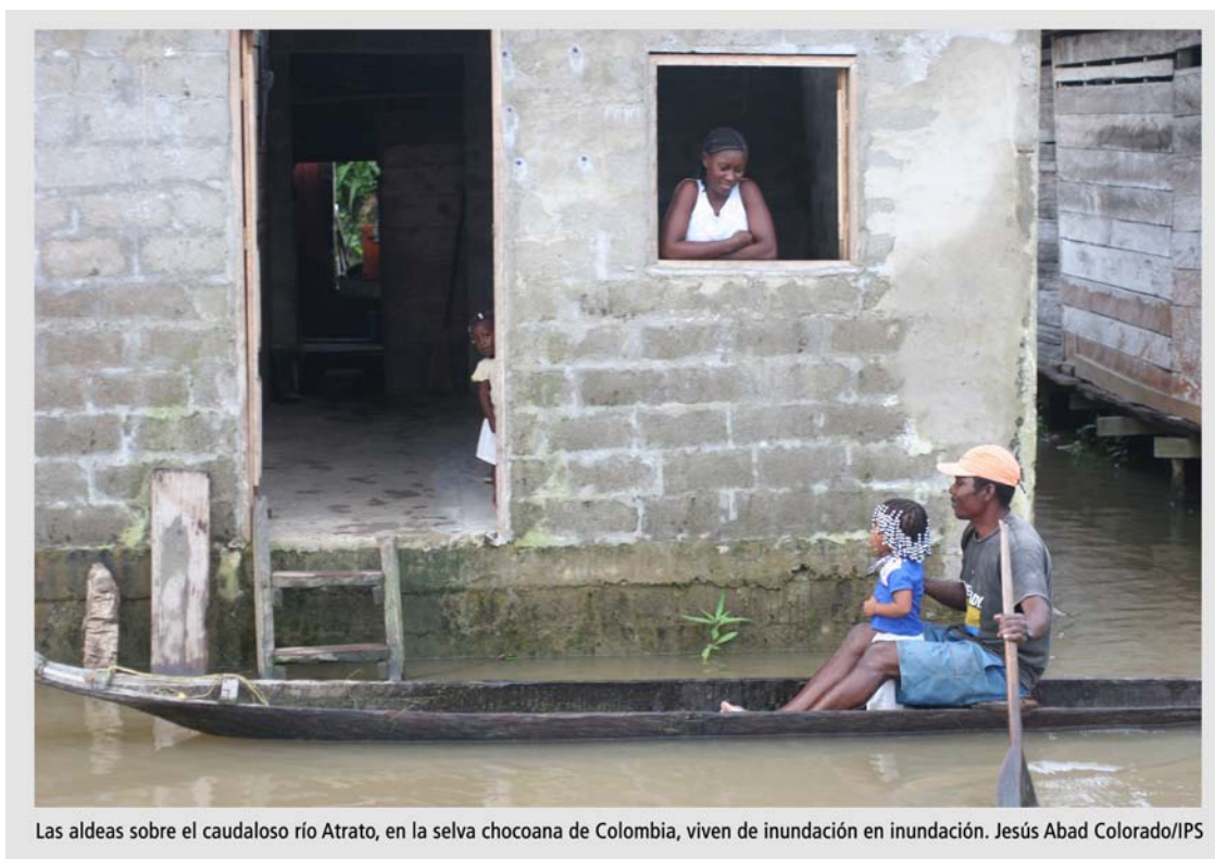
Las aldeas sobre el caudaloso río Atrato, en la selva chochoana de Colombia, viven de inundación en inundación.

La región contribuye poco a la generación de emisiones, pero igualmente las sufre. “Figura entre las más vulnerables, por estar localizada dentro de la franja de huracanes y tener numerosos Estados insulares y zonas