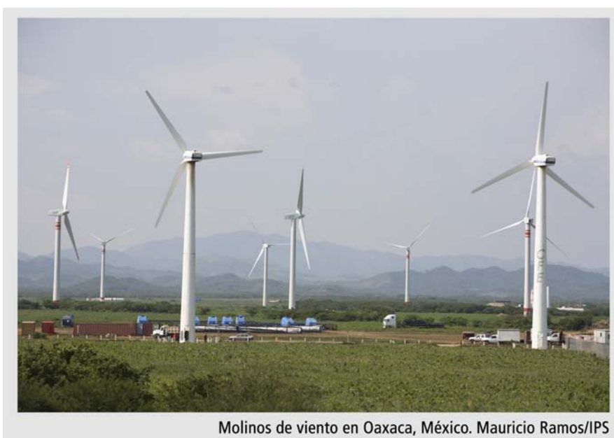
Molinos de viento en Oaxaca, México.

destinado al aprovechamiento del estiércol del ganado para generación de biogás y biofertilizante, que ha despertado interés de numerosos productores del ramo de la quesería artesanal. La expansión de esta técnica, considera Sena, logrará un impacto no despreciable en la reducción de las emisiones de metano, a la vez que se genera un beneficio económico para los pequeños productores, debido al ahorro de combustible de origen fósil y de