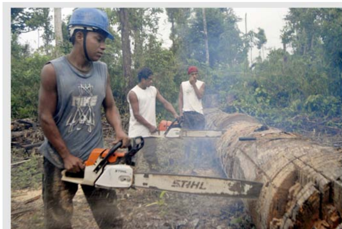
Tala de árboles en la Región Autónoma del Atlántico Norte, Nicaragua.

Amazonia --la selva tropical más grande del mundo-- se está transformando en forma acelerada en una extensa sabana; su exuberante vegetación y su suelo son sustituidos por una cubierta de pastos, propios de tierras más secas. Más de 75 por ciento de las emisiones brasileñas de gases de