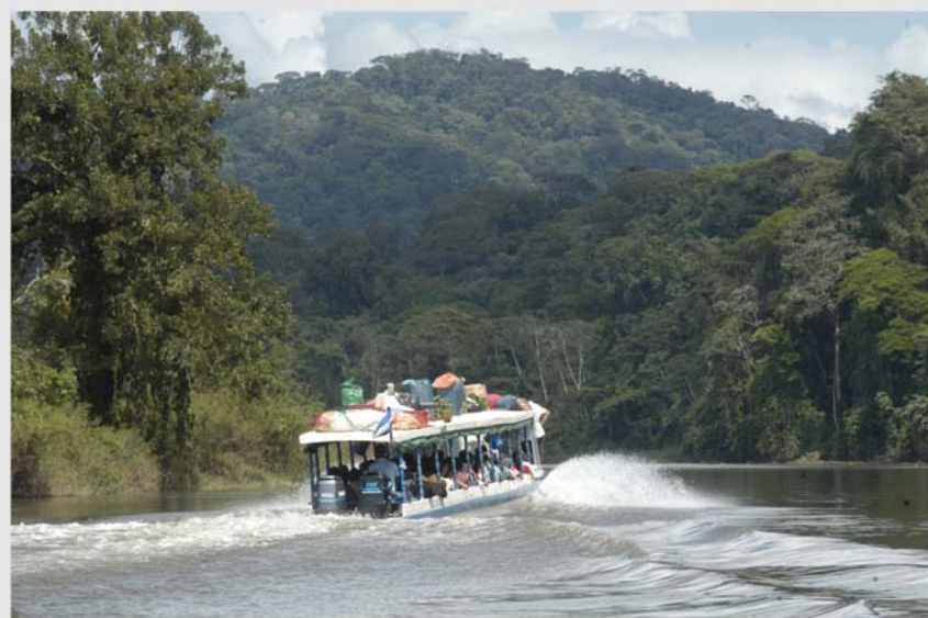
Navegación fluvial en Costa Rica.

ello se denominan gases de efecto invernadero (GEI). Los más importantes son el dióxido de carbono (CO 2 ), el metano (CH 4 ), el óxido de nitrógeno (N 2 O), el vapor de agua, el ozono (O 3 ) y los halocarbonos o grupos de gases conocidos como clorofluorocarbonados (CFC) pues contienen carbono, flúor, cloro y bromo. Cuando la radiación solar llega a la Tierra, parte de ella se transforma en calor. Los GEI (principalmente el dióxido de carbono) se encargan de absorberlo y de retener la radiación. La cantidad de calor que se retiene determina la temperatura global del planeta y este mecanismo impide que los días sean demasiado calurosos o las noches demasiado frías. Pero, además, las actividades humanas generan emisiones de cuatro GEI de larga permanencia, es decir aquellos que siguen activos en la atmósfera