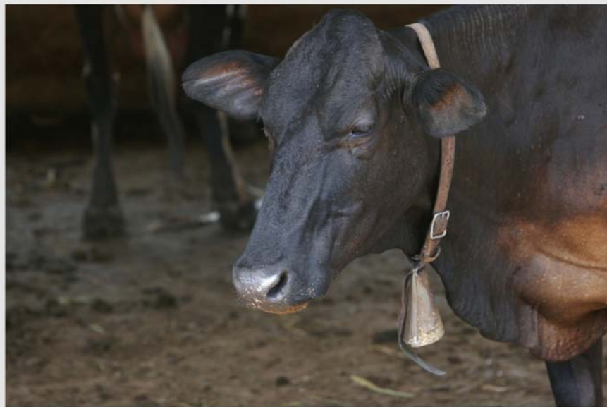
Cría de vacunos en Brasil. La ganadería es uno de las grandes fuentes de gas metano de la región.

bases de datos de clima y de producción agropecuaria confiables y que abarquen períodos extensos, entre 80 y 100 años. En la región, destacó, hay muy pocos países que tienen ese tipo de