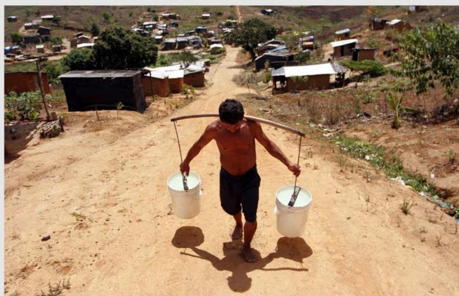
Acarreo de agua en el asentamiento de campesinos sin tierras Chico Mendes, Pernambuco, Brasil.

costeras bajas, por depender de los deshielos andinos para suministro de agua a los sectores urbano y agrícola y por estar expuesta a inundaciones e incendios forestales”,